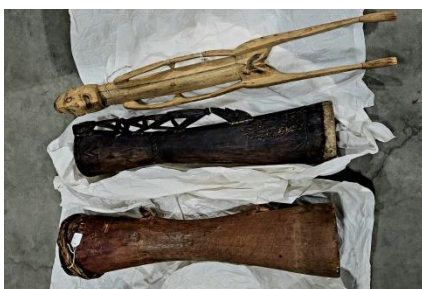
Enkele van de 1400 artefacten