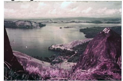
Cycloopgebergte met Sentanimmeer