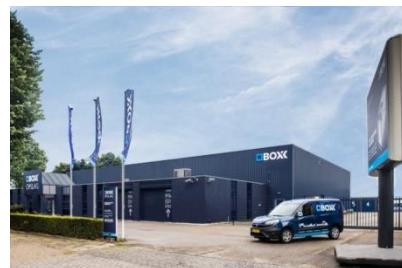
Boxx opslag – Amersfoort

werd voorgespiegeld. Allereerst bleek de verhuizing van de stukken uit de collectie van Het Koninklijk Paleis Soestdijk plotseling in een stroomversnelling te zijn gekomen. En ja, die gingen natuurlijk voor. Ten tweede dienden we een nieuwe accurate inventarisatie van de te verhuizen stukken te maken. Het bleek dat er verschillende lijsten in omloop waren, dat de aangegeven opslaglocaties bij depot Pot niet accuraat waren, er dubbele nummers gebruikt waren en de labels niet altijd met de lijsten overeenkwamen. Kortom er zat niets anders op dan de lijsten op orde te brengen en de stukken fysiek in de opslag te controleren en waar nodig in overeenstemming te brengen. Die operatie zit er nagenoeg op, op het moment dat deze nieuwsbrief verschijnt.