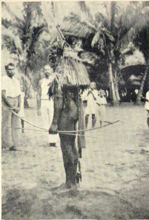
1. Marind-man in oorspronkelijke dracht (Domandé).