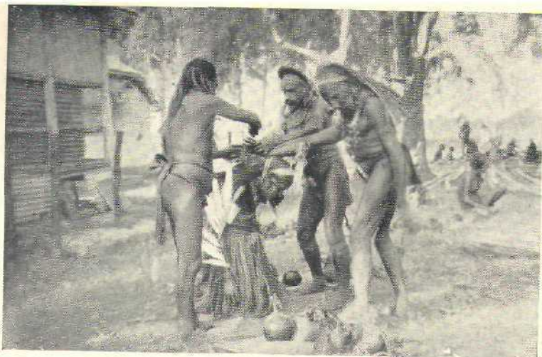
5. Een weiko-figurant wordt opgesierd.