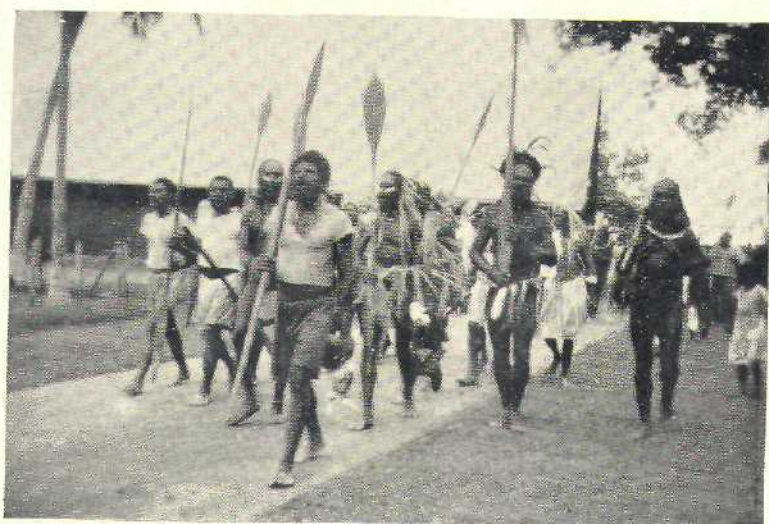
6. Mannen bij aankomst voor een feest te Merauke (enkelen zijn met jonge palmladeren versierd).