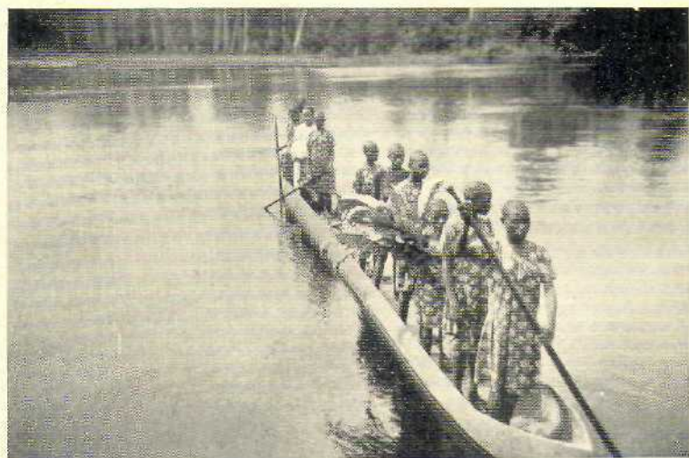
8. Schoolmeisjes van Eramboe (Midden-Maró) op hun Zondagsch.