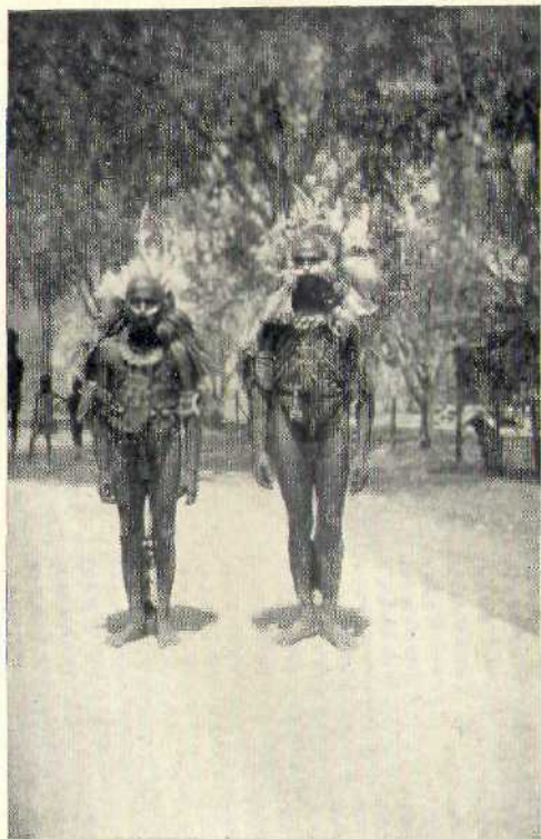
3. Marind-mannen in feesttooi.