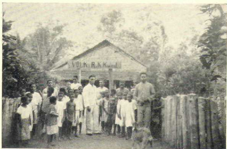
7. School met kinderen en kamponghoofd te Kowel (Boven-Maró).